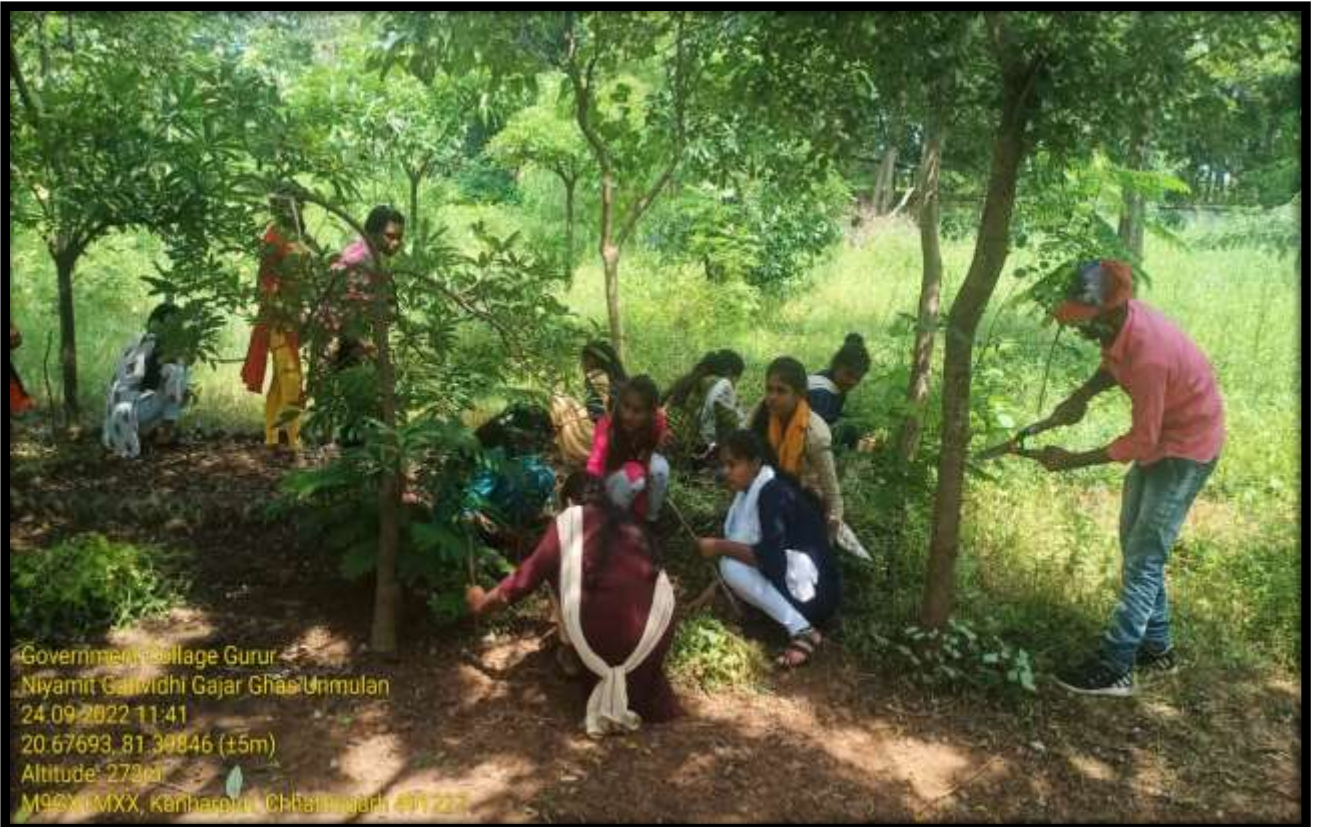
Government College Gurur Niyamit Garwidhi Gajar Ghas Unmulan 24.09.2022 11:41 20.67693, 81.39846 (15m) Altitude: 279m M92YJVMXX, Karmachari Chhatrapati 401227