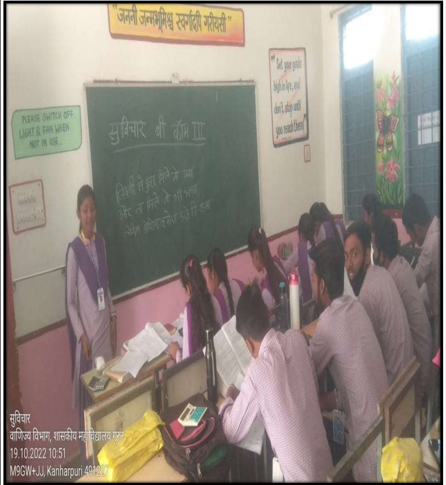
Evidence- Photograph, maintained register

सुविचार वाणिज्य विभाग, शासकीय महाविद्यालय गुरु 19.10.2022 10:51 M9GW+JJ, Kanharpuri 491227