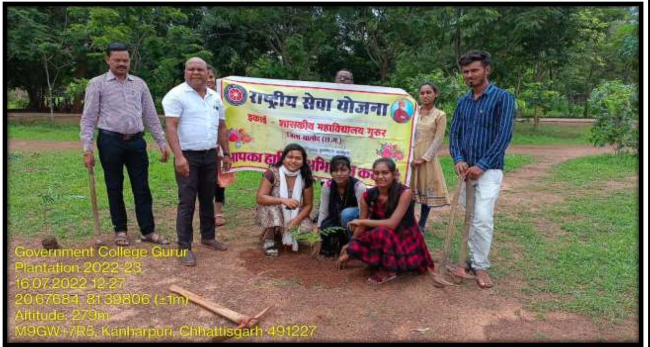
Government College Gurur Plantation 2022-23 16.07.2022 12:27 20.67684, 81.39806 (+1m) Altitude: 279m M9GW+7R5, Kanharpur, Chhattisgarh 491227