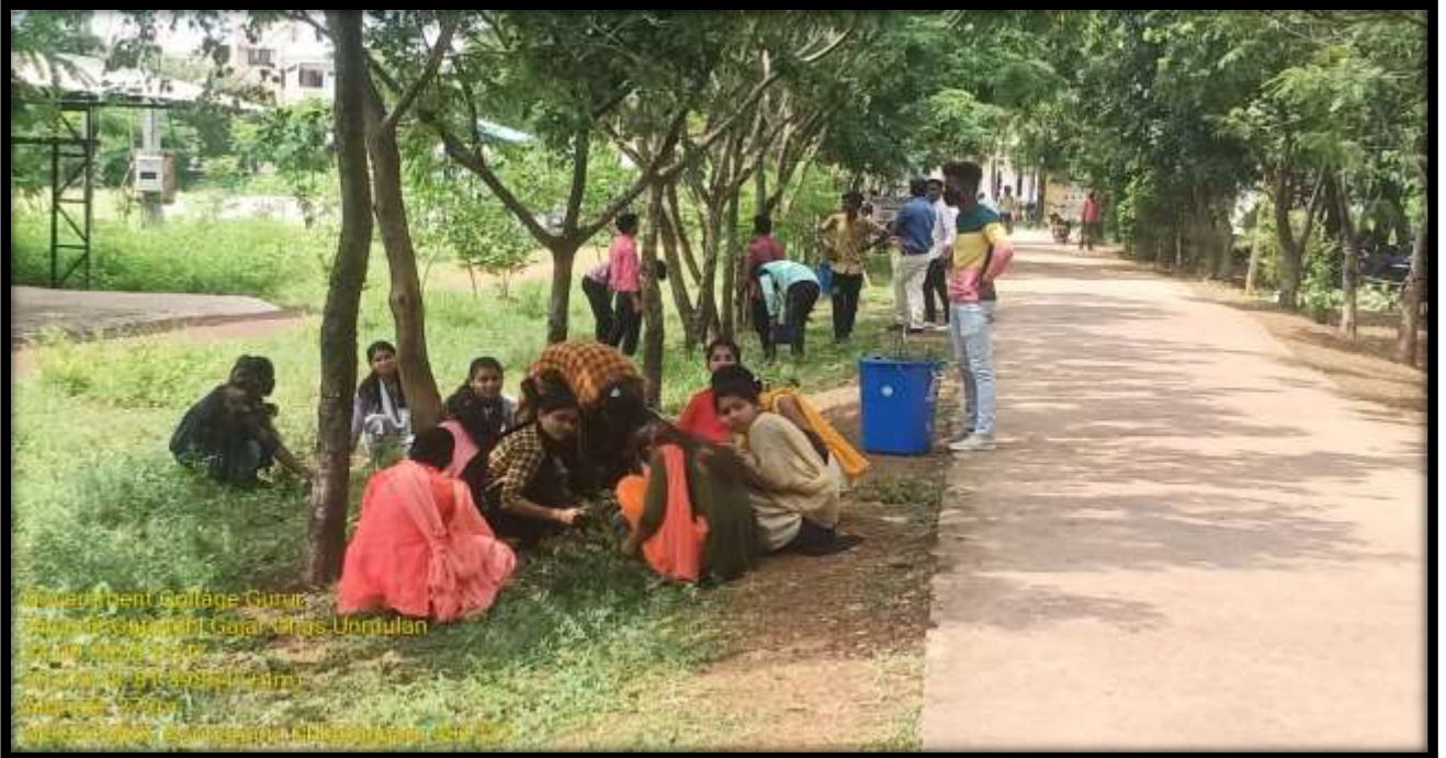
Government College Gurur Niyamit Garwidhi Gajar Ghas Unmulan 24.09.2022 11:41 20.67693, 81.39846 (15m) Altitude: 279m M92YJVMXX, Karmachari Chhatrapati 401227