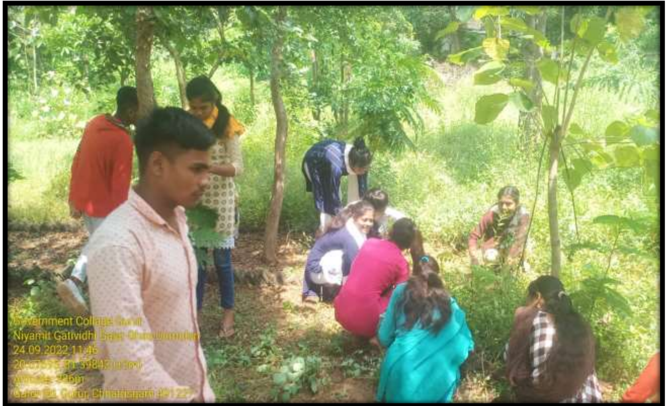
Government Collage Gurur, Niyamit Gatividhi Gajar, Bhas-dumelan 24.09.2022 11:46 20.67694, 81.38847 (+3m) Altitude: 272m Gurur Rd, Gurur, Chhattisgarh 491327