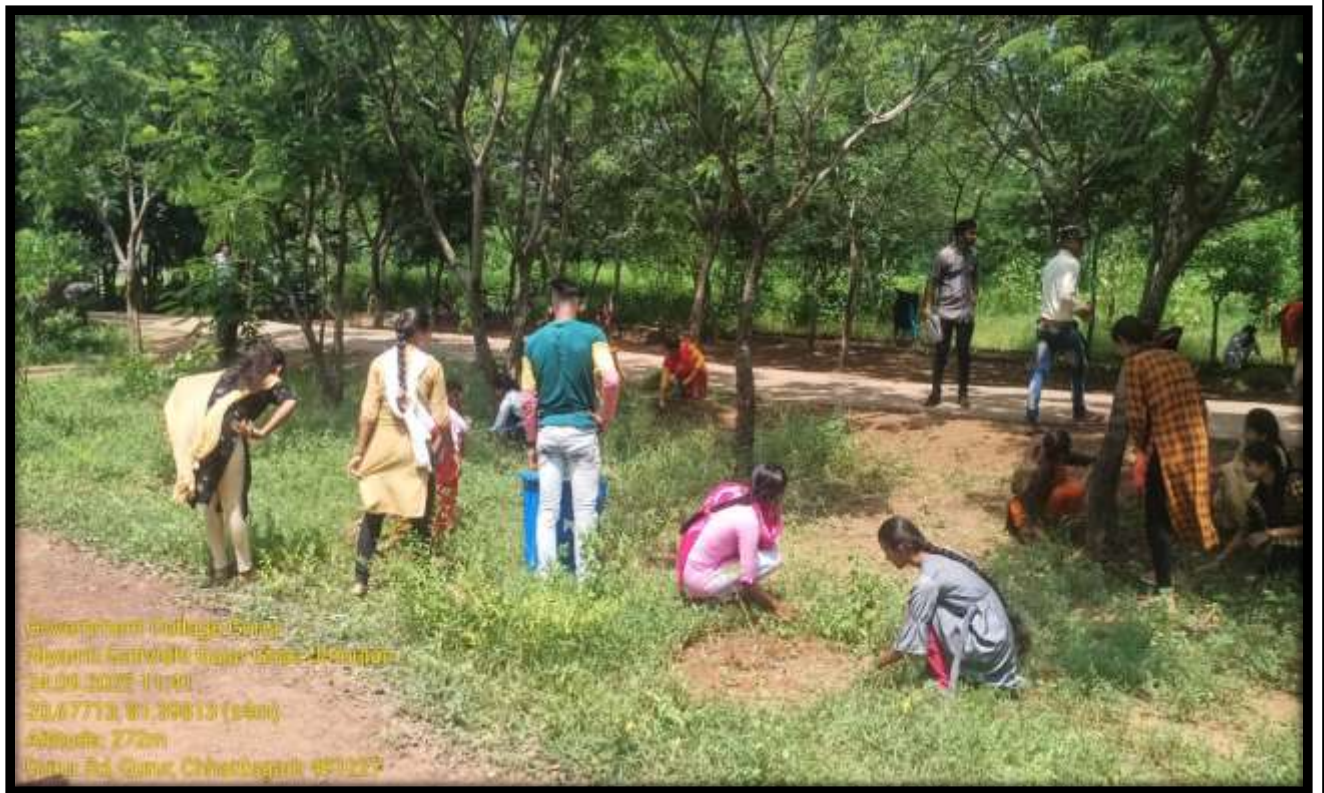
Government College, Guwahati Department of Botany, Guwahati Date: 20/07/2025 Time: 11:30 AM Location: Rd. Guwahati, Assam 781005