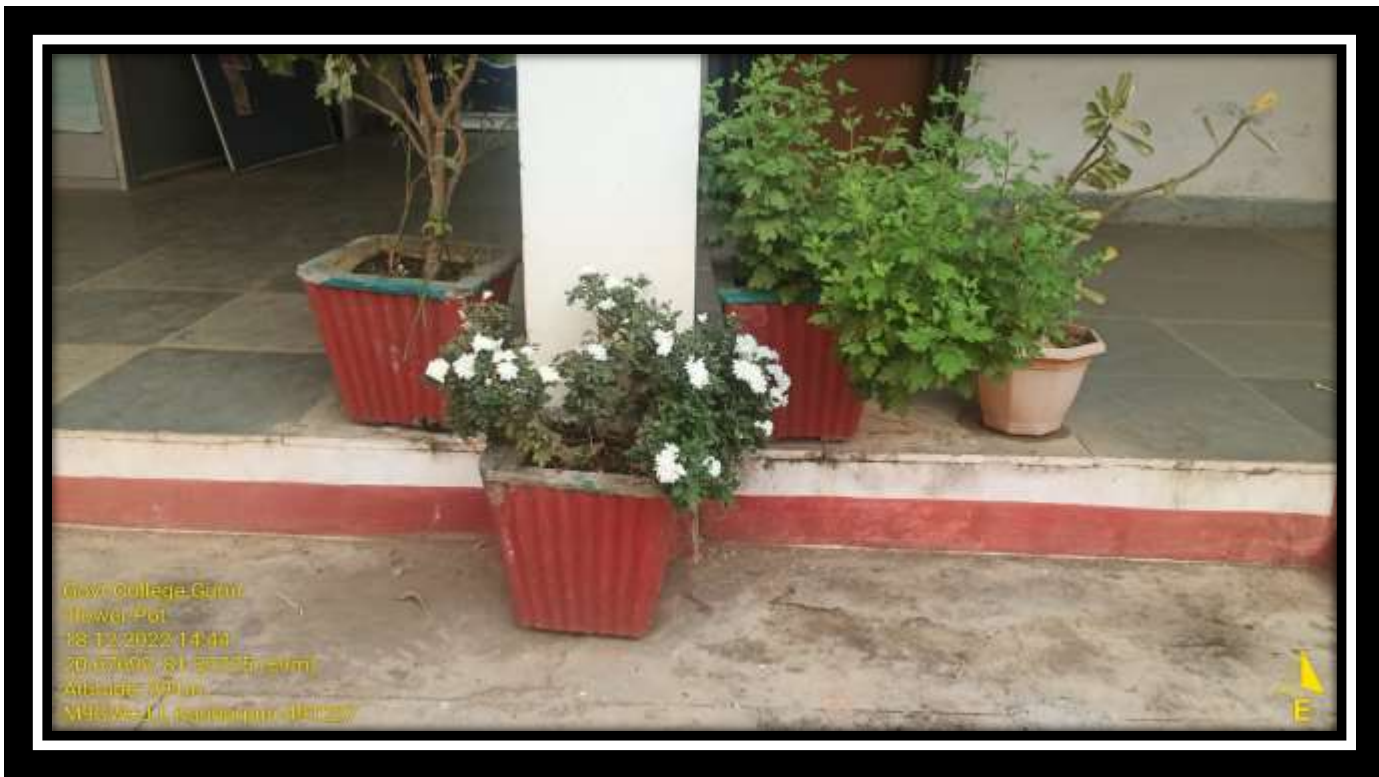
Gwv College Gm Flower Pot 18-12-2022 14:00 20.67609, 81.39748 (43m) Altitude: 338m M9GW+JJ, Kanharuni 491227