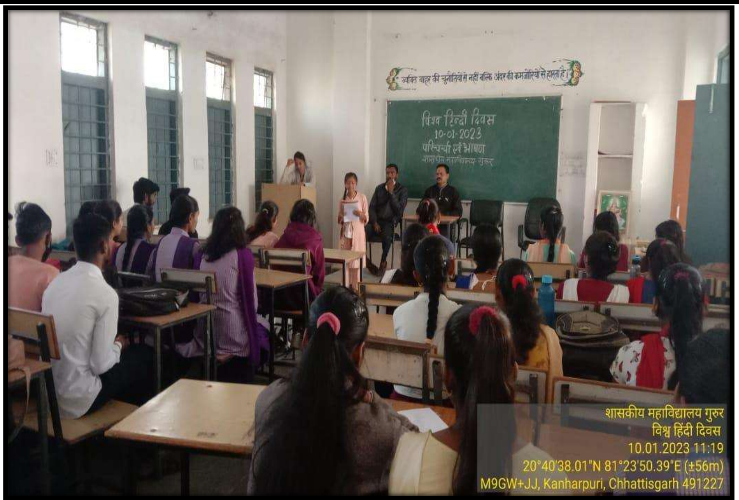
शासकीय महाविद्यालय गुरु विश्व हिंदी दिवस 10.01.2023 11:19 20°40'38.01"N 81°23'50.39"E (±56m) M9GW+JJ, Kanharpuri, Chhattisgarh 491227