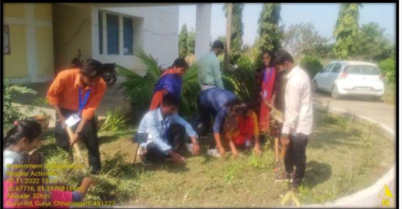
Government College Gurur Regular Activities 05.11.2022 13:03 20.67716, 81.39768 ( \pm 4m ) Altitude: 326m Gurur Rd, Gurur, Chhattisgarh 491227