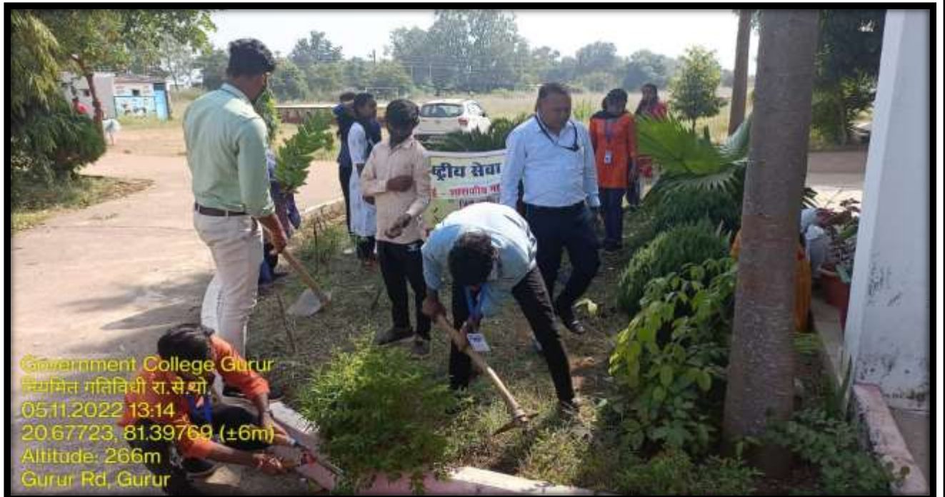
Government College Gurur नियमित गतिविधि रा.से.यो. 05.11.2022 13:14 20.67723, 81.39769 (+6m) Altitude: 266m Gurur Rd, Gurur