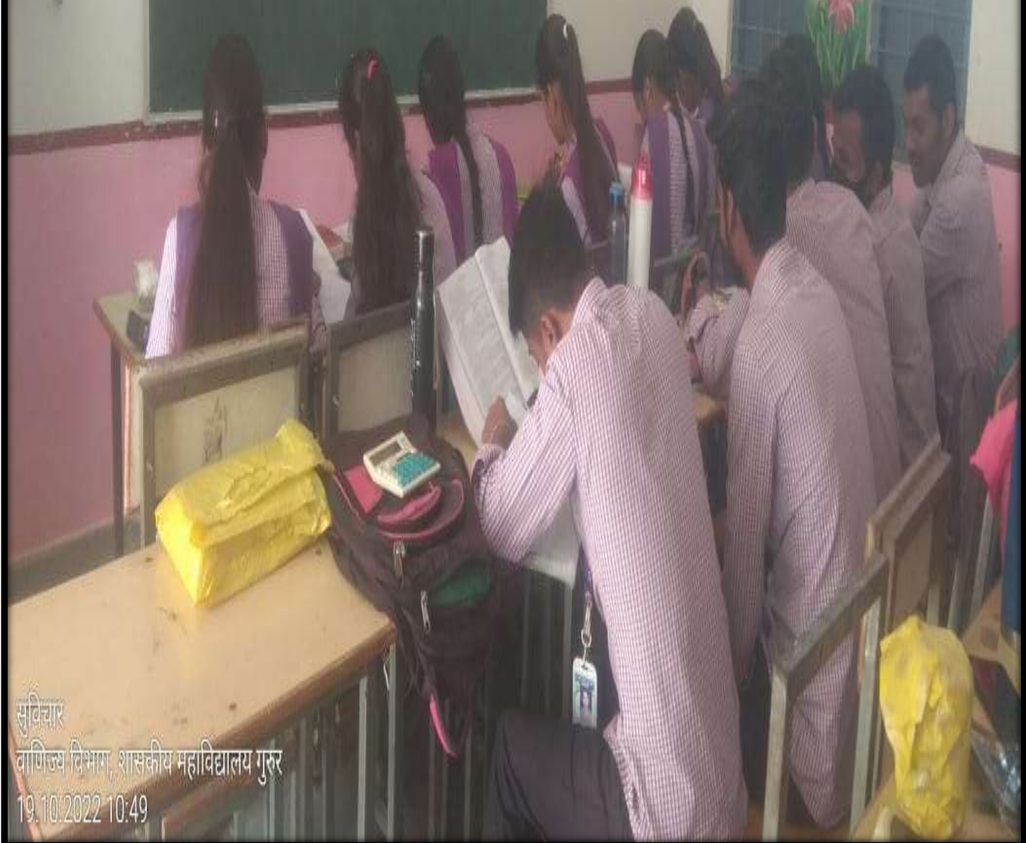
सुविचार वाणिज्य विभाग, शासकीय महाविद्यालय गुरु 19.10.2022 10:49