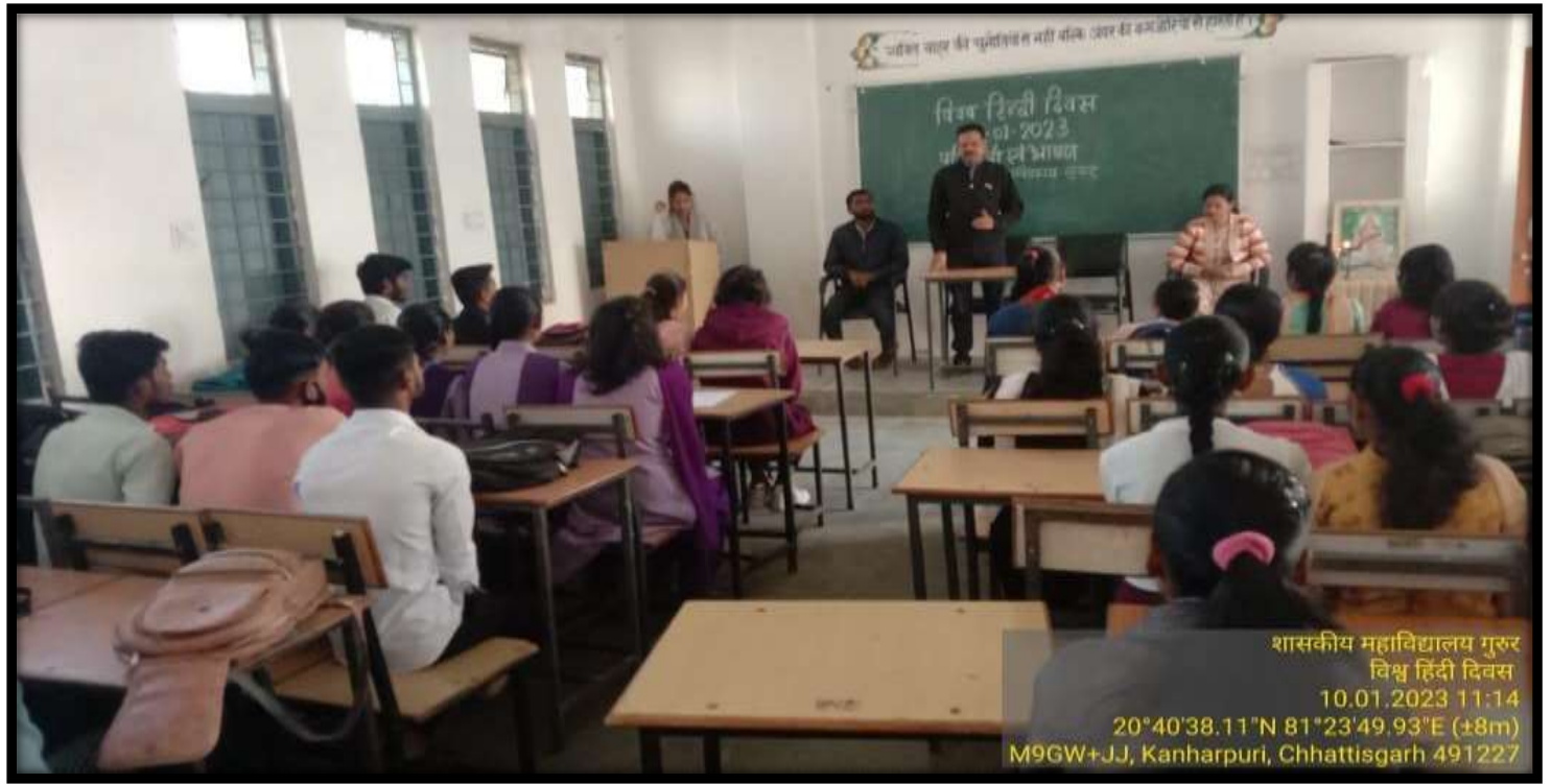
शासकीय महाविद्यालय गुरु विश्व हिंदी दिवस 10.01.2023 11:14 20°40'38.11"N 81°23'49.93"E (±8m) M9GW+JJ, Kanharpuri, Chhattisgarh 491227