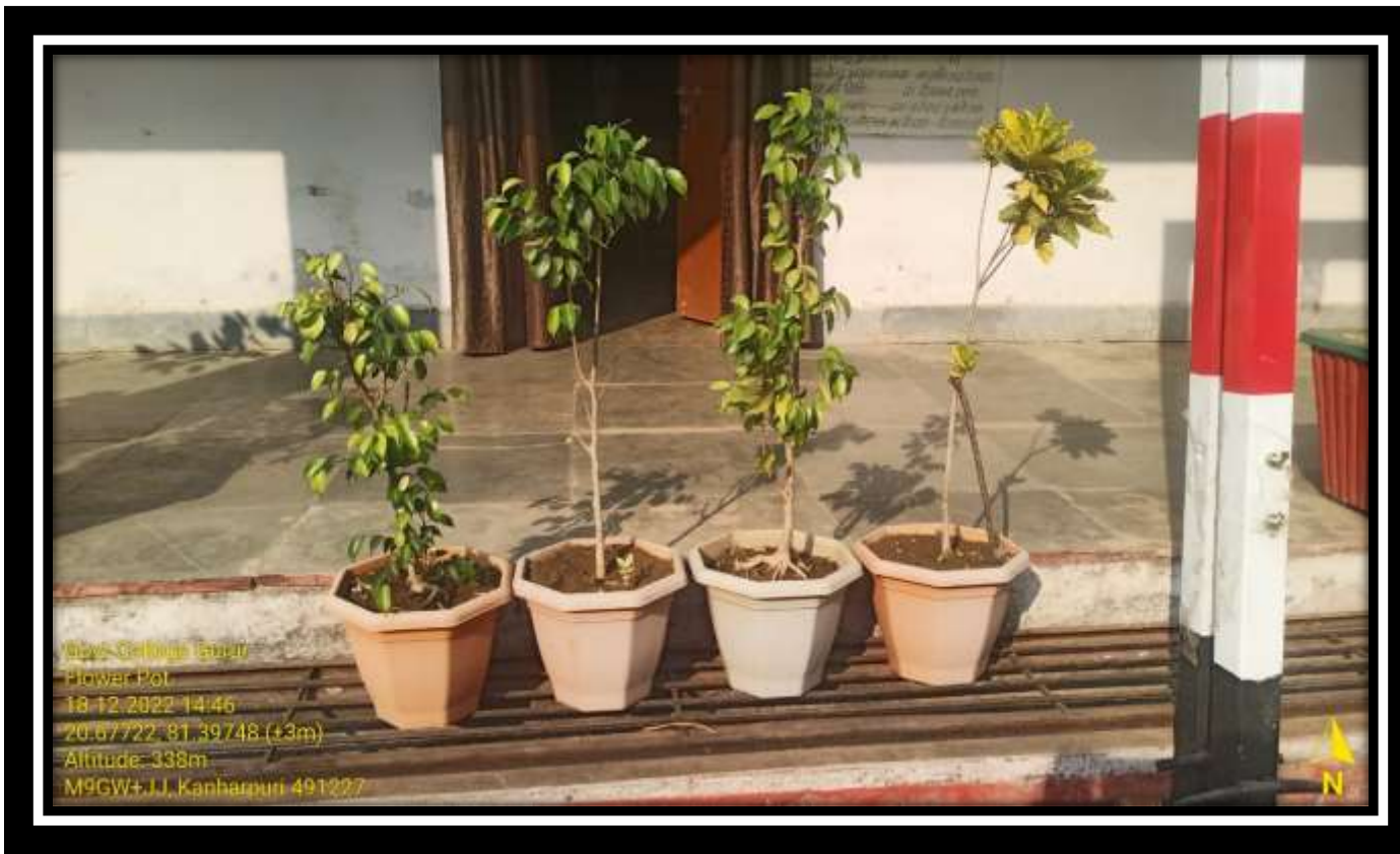
Gwv College Gm Flower Pot 18-12-2022 14:46 20.67722, 81.39748 (43m) Altitude: 338m M9GW+JJ, Kanharuni 491227