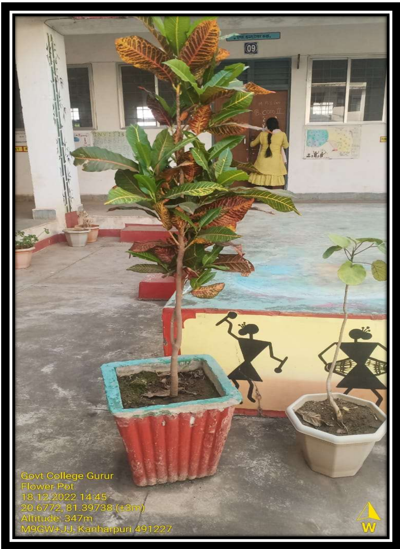
Govt College Gurur Flower Pot 18.12.2022 14:45 20.6772, 81.39738 (±3m) Altitude: 347m M9GW+JJ, Kanharpuri 491227