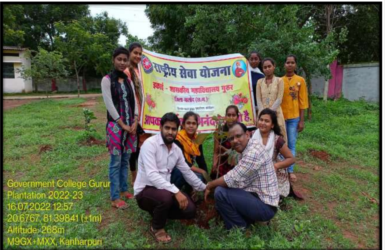
Government College Gurur Plantation 2022-23 16.07.2022 12:57 20.6767, 81.39841 ( \pm 1m ) Altitude: 268m M9GX+MXX, Kanharpuri