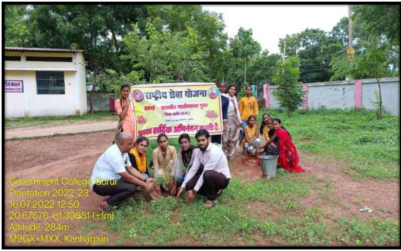
Government College Gurur Plantation 2022-23 16.07.2022 12:50 20.67676, 81.39851 (+1m) Altitude: 284m M9GX+MXX, Kanharpur