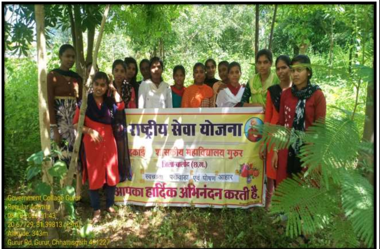
Government Collage Gurur Regular Activity 05.11.2022 11:43 20.67729, 81.39813 (+3m) Altitude: 343m Gurur Rd, Gurur, Chhattisgarh 491227