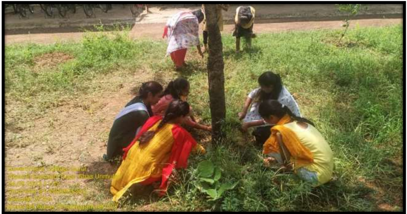
Government College, Guwahati Department of Botany, Guwahati Date: 20/07/2025 Time: 11:30 AM Location: Rd. Guwahati, Assam 781005