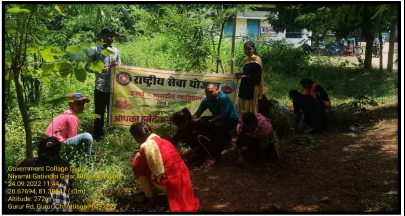
Government Collage Gurur, Niyamit Gatividhi Gajar, Bhas-dumelan 24.09.2022 11:44 20.67694, 81.38847 (+3m) Altitude: 272m Gurur Rd, Gurur, Chhattisgarh 491327