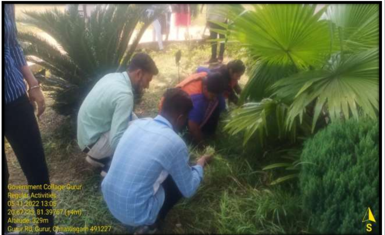
Government Collage Gurur Regular Activities 05-11-2022 13:05 20.67723, 81.39767 (+4m) Altitude: 329m Gurur Rd, Gurur, Chhattisgarh 491227